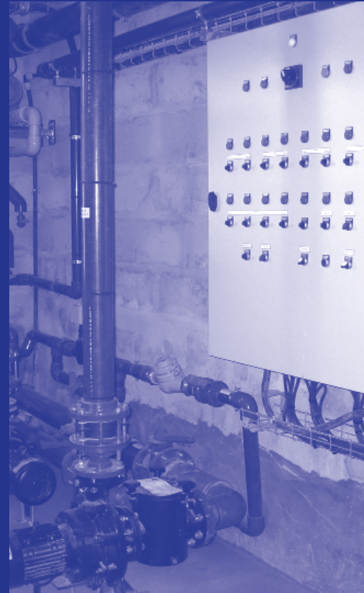
Installation sur site / Installation