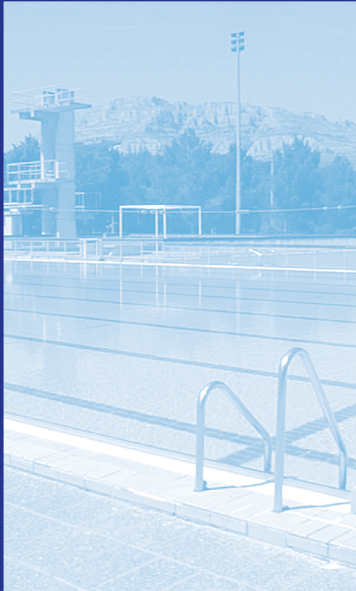
France, Luminy : 3 bassins/pools - 150 kVA