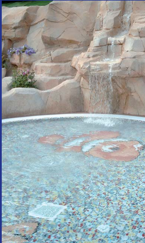
France, Camping d'Agde : 1 bassin/pool - 70 kVA